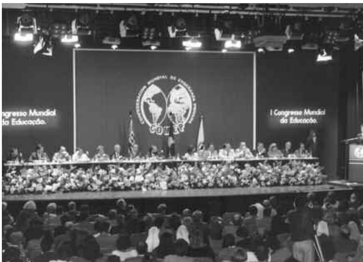
1er Congreso de Educación celebrado en Sao Paulo en Julio de 1990

El pasado 30 de octubre, la Confederación Mundial de Enseñanza Privada (COMEP) recibió de parte de la Organización de las Naciones Unidas para la Educación, la Ciencia y la Cultura (UNESCO) el estatus de ONG con Relaciones de Cooperación Permanente por las acciones desarrolladas en materia de Educación, que la institución ha realizado durante 26 años.