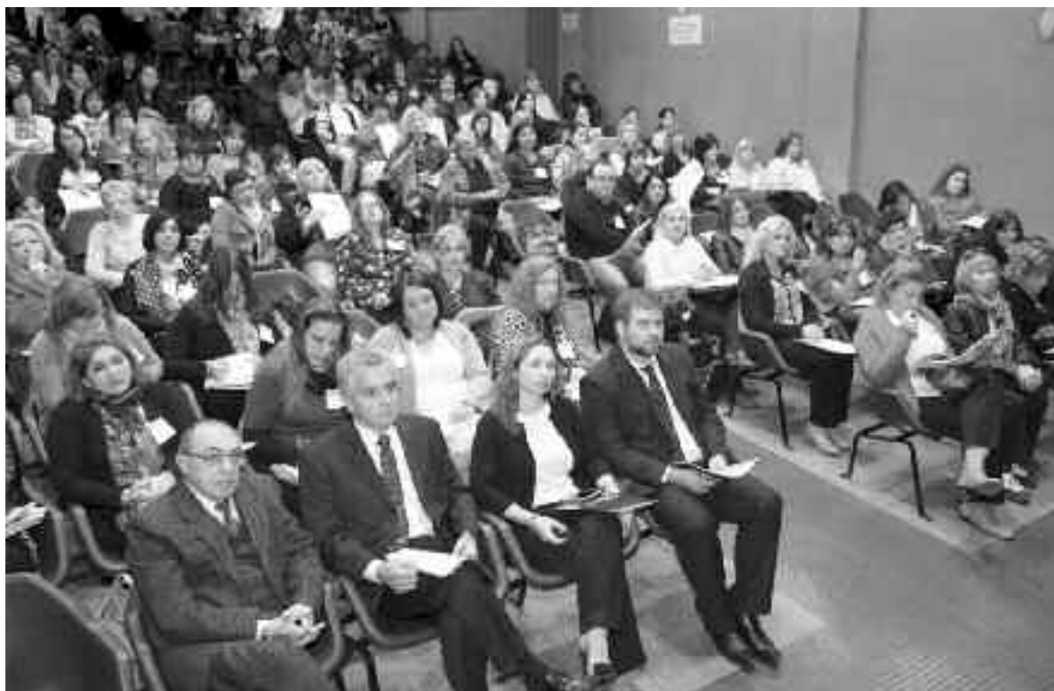
Directivos, docentes y estudiantes durante la presentación de la Jornada